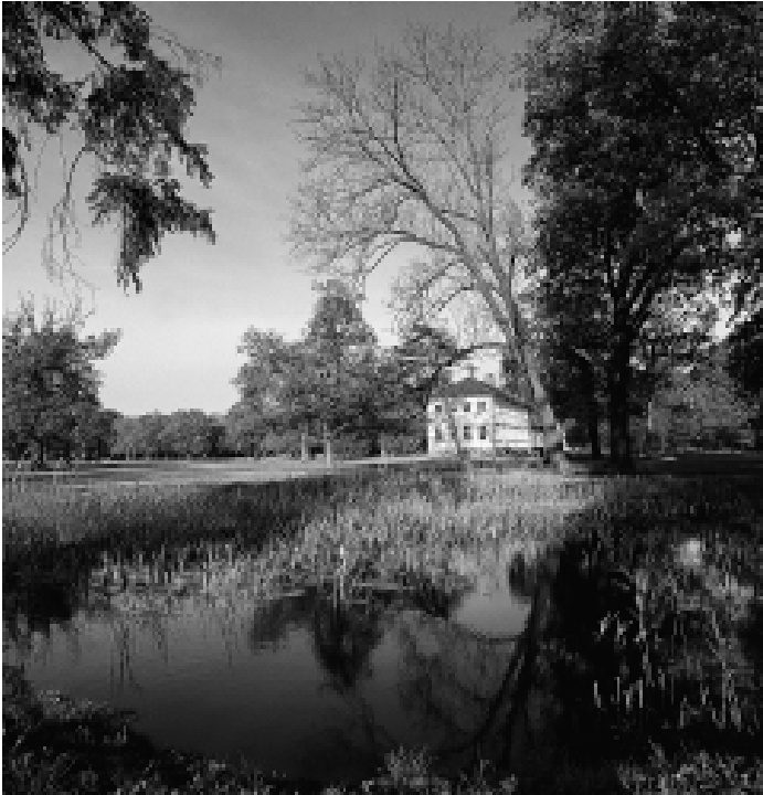
Blick durch den Schloßpark in Baruth zum Neuen Schloß

mit der Bahn: von Berlin Zoologischer Garten über Berlin Alexanderplatz, Berlin Ostbahnhof, Berlin Schönefeld Flughafen, Blankenfelde und Zossen bis Baruth (RE 5)